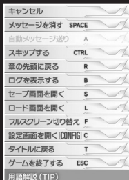
[プルダウンメニュー画面]