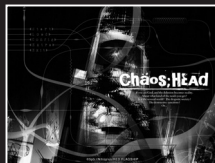
[タイトルメニュー画面]

※一度物語のエンディングを見なければ、EXTRA画面へ進めるためのボタンは表示されません。