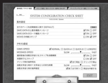
[CONFIG (設定) 画面]