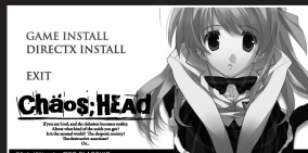
[インストール画面]

本製品のGAME DISC(DVD-ROM)をドライブに挿入するとインストールメニュー画面が立ち上がります。メニュー画面内のインストールボタンをクリックすると、セットアッププログラムが立ち上がります。画面の指示に従い操作を進めてください。最初にシリアルコードを入力するダイアログが表示されます。パッケージに同封されているユーザーカードにシリアルコードが印字されているので、シリアルコードをダイアログ欄に入力しOKボタンを押してください。インストールされる容量が表示された後、セットアッププログラム終了のメッセージが表示され、ゲームが起動します。次回以降の起動には、デスクトップのゲームアイコンをダブルクリックもしくは、「スタート」→「すべてのプログラム」→「CHAOS;HEAD The Best」→「CHAOS;HEAD The Best」を選択するとゲームが起動します。DVD-ROMをドライブに入れてもオートスタートが始まらない場合、DVD-ROM内にある、CHTBSetup.exeをダブルクリックしてください。インストールメニュー画面が立ち上がります。