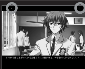
[妄想トリガーシステムの一部]