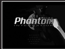
[タイトルメニュー画面]

※一度物語のエンディングを見なければ、EXTRA画面へ進めるためのボタンは、表示されません。